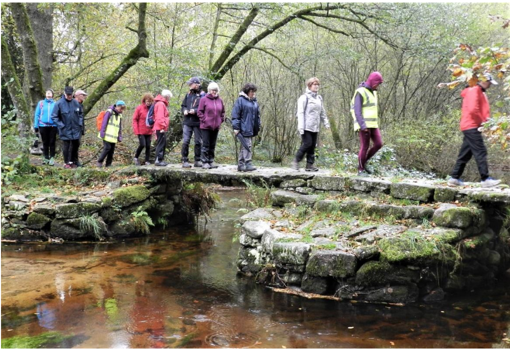
Un pont de pierre