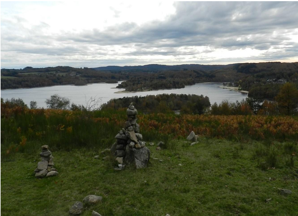
Un cairn veille sur le lac de Vassivière