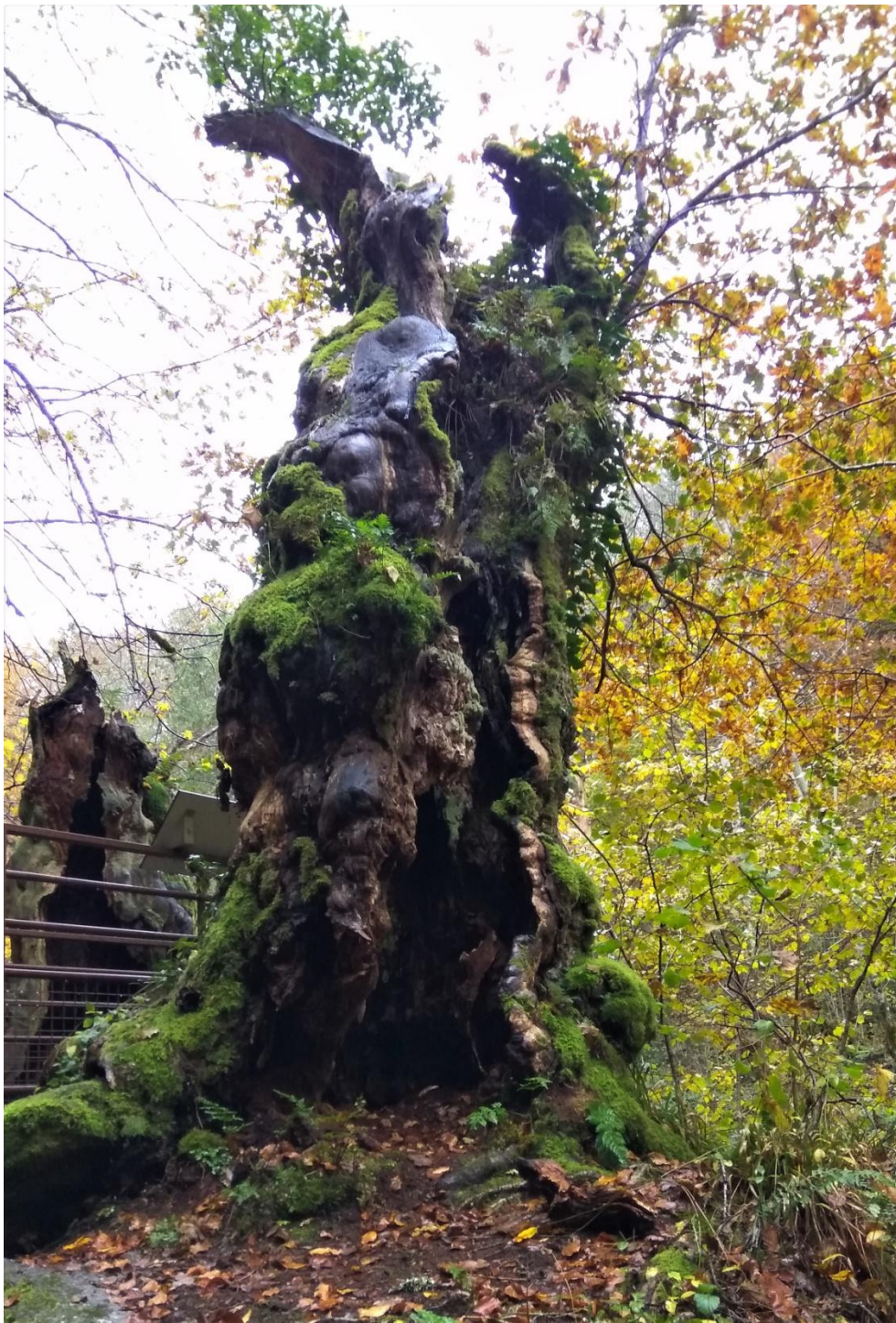
Un troll au pied de la cascade des Jarrauds