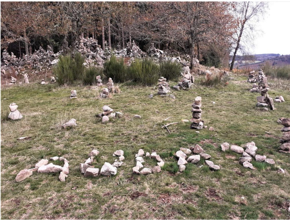
Un souvenir sur la presqu'île de Chassagnas