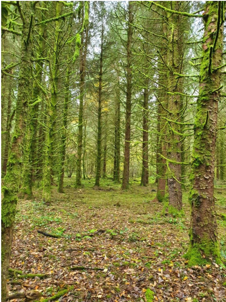
Il est où le nord ?